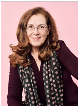
Andrea Gronemeyer Intendantin der Schauburg. Theater für junges Publikum der LH München